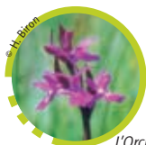
L'Orchis de Traunsteiner