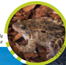
La grenouille rousse

Autrefois, les paysans récoltaient sur le marais la « bauche », employée pour la litière des animaux ou pour le rempaillage des chaises. Ces pratiques anciennes ont permis l'entretien du marais, espace ouvert ménageant une ouverture paysagère entre l'urbanisation du village et la grande forêt de Chartreuse.