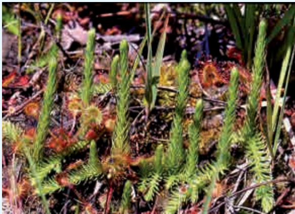
Lycopode des tourbières

Depuis 1997, une gestion partenariale entre la commune, AVENIR et l' Office National des Forêts permet la conservation du site aujourd'hui classé Espace Naturel Sensible par le Conseil général de l'Isère .